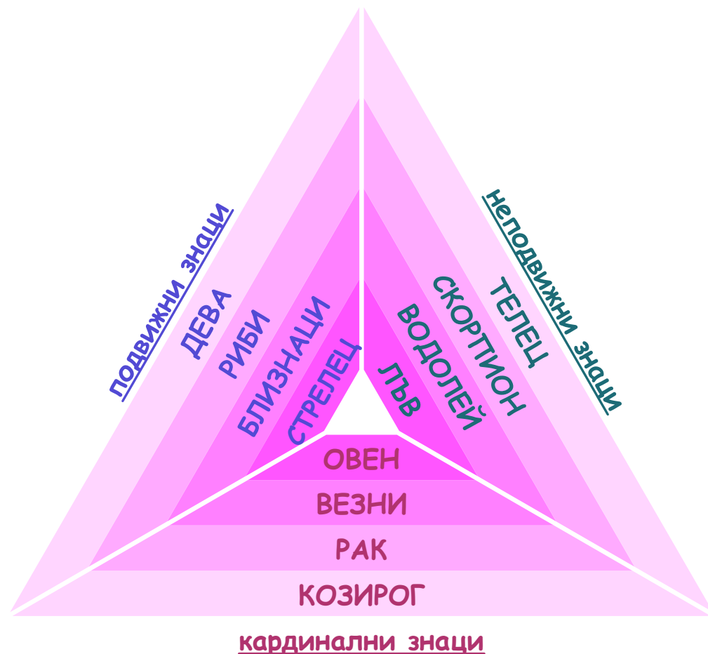
КВАДРАТ НА СТИХИИТЕ