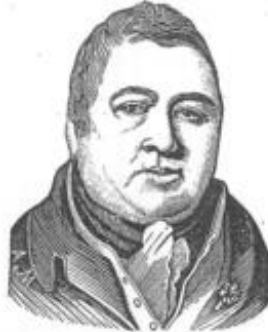
Фиг. 10. Флегматически темпераментъ.

жива нѣкакво особено влияние, както днесъ неговата функция е приета да е най-важната въ животната управа. Вниманието на Д-ритъ Галъ и Спурзеумъ е било обърнато на този фактъ и тѣ почувствували потребността да сметатъ мозъка за особно темпераментално състояние.