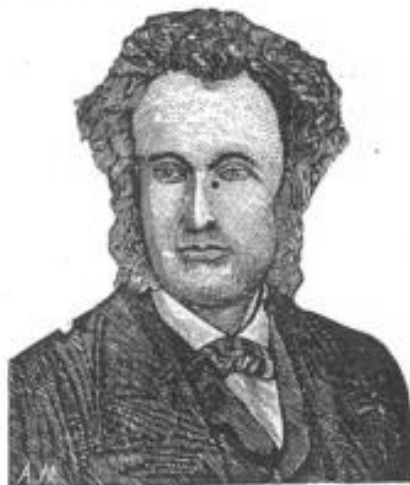
Фиг. 12. Нервически темпераментъ.

Витивната или питателната система е тъй също съставена отъ три класа органи: лимфата, кръвоноснитѣ садове и жлезитѣ, които посредствомъ тѣхнитѣ функции на поглъщане, кръвообращение и отдѣлене са инструментитѣ за тѣлесното хранене и прѣчистване. Когато тази система отъ органи прѣодолява съ своето дѣйствие, образува едно физиологическо състояние или разположение на тѣлото, което въ новата класификация се нарича витивенъ темпераментъ.