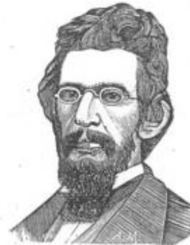
Фиг. 11. Холерическия темпераментъ.

Сангвиническия темпераментъ (фиг. 9) зависи отъ прѣобладаващото влияние на дробоветѣ, сърдието и кръвоноснитѣ садове; той се отличава съ умѣрена пълнота на тѣлото и частитѣ; достатъчно набита плътъ, руса коса или кестелева, сини очи, ружентъ цвѣтъ, ружено и обло лице. Притежава голѣма дѣятелностъ на артериалната система и особено пристрастие за леки утѣжнения. Мозъка изобицо е много дѣятеленъ и умственитѣ изявиения са бързи и магнетически. Лица съ този темпераментъ са готови къмъ сичко. Тѣ приематъ сичко набързо и нѣматъ време да обсаждатъ дълбоко работитѣ.