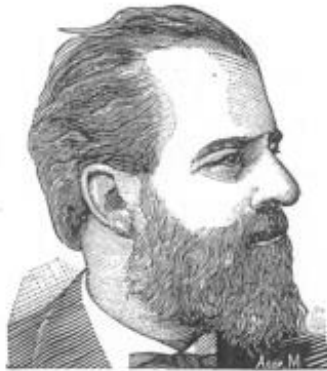
Фиг. 9. Сангвинически темпераментъ.

Споредъ учението на Хипократа, „бащата на медицината“, установени са били четири главни темпераменти, които зависели, споредъ него, отъ четиритѣ първоначални