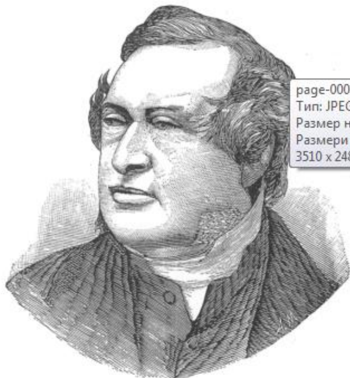
Фиг. 14. Норманъ Виклътъ. Витъвенъ темпераментъ.

приятна, които изискватъ голѣмо усилие на тѣлеснитѣ сили, тѣ са повечето наблюдатели, отколкото мислители и се отличаватъ съ голѣма твърдостъ, прѣдприимчивостъ, постоянство и себенадѣяностъ въ работата